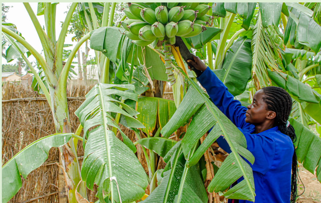
En studerende på kurset Landbrugsfødevarer inspicerer en bananplantage.