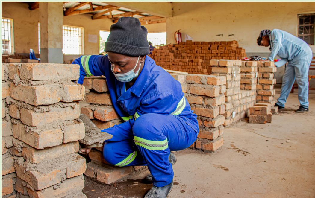
En murerlærling i fuld gang med en praktisk lektion.