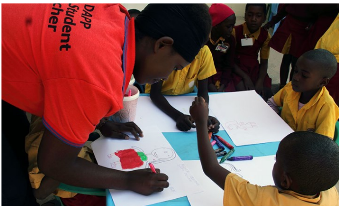
Studerende ved POF-projektet tegner med børnehavebørn i Namibia.