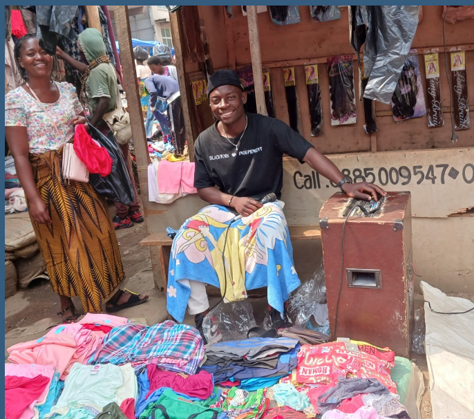
Sælgere på tøjmarked i Malawi.