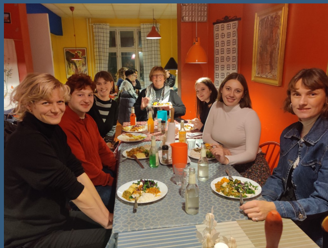
Julehygge for frivillige fra butikken på Vesterbrogade.

Selvom der er mange udfordringer på nationalt og internationalt plan, som kræver mediernes og borgernes opmærksomhed, er det vigtigt at huske på alle de fremskridt, løsninger og udviklinger, der i dén grad også fortjener spalteplads.