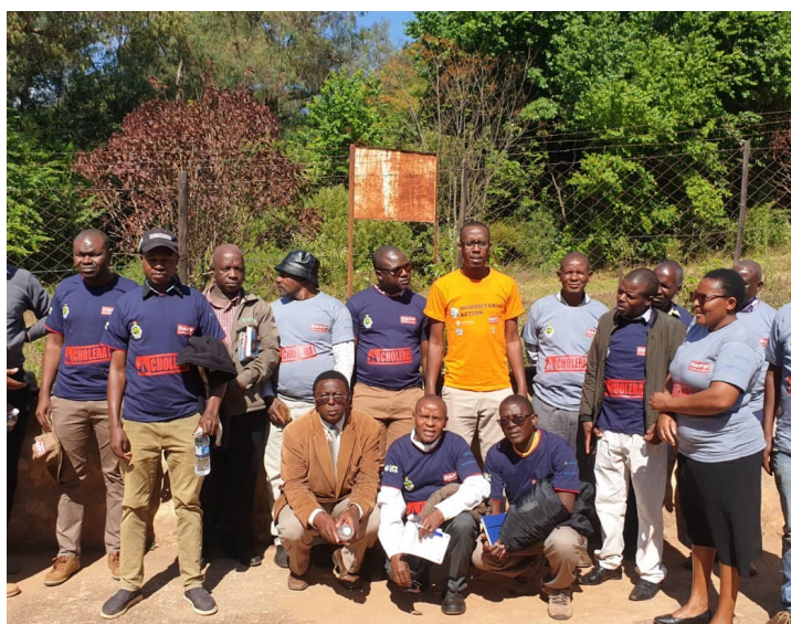
Medarbejdere og leder i kolera-kampagnen i Chimanimani, Zimbabwe.