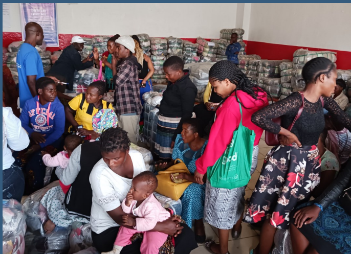
Handelskvinder køber tøj i DAPP Malawis lagersalg.

Blandt de helt store oplevelser var besøget på sorteringscentralen, som Development Aid from People to People (DAPP) Malawi driver. Her sorteres der genbrugstøj i omkring 100 kategorier, som derefter bliver solgt på DAPPs lagersalg til kunder, som sælger det videre på lokale tøjmarkeder. Udover at forsyne sælgerne med tøj, arbejder DAPP også aktivt med at uddanne dem i forretningsledelse og salg, ligesom de får hjælp til at oprette en bankkonto, så de kan holde styr på deres økonomi.