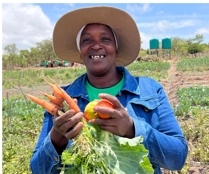
Stolt farmer i Zimbabwe viser afgrøder frem.

DAPPs forebyggelseskampagne er derfor ekstremt vigtig, da den har til formål at informere befolkningen i Zimbabwe om kolerasymptomer, samt at forbedre sundheds- og hygiejne-praksis, bl.a. ved at sørge for adgang til rent vand. På den måde er DAPP med til at sikre, at befolkningen ved, hvordan de kan beskytte sig selv mod at blive smittet, og hvad de skal gøre, hvis de bliver syge.