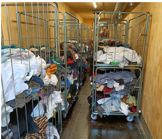
Vådt tøj fra FUGT-projektet bliver tørret.

UFF-Humanas rolle i partnerskabet er at forsortere tekstilaffaldet, tørre de rene, men fugtige tekstiler og derefter sortere igen for at afgøre, om tørringen har gjort nogle af tekstilerne egnede til genanvendelse eller genbrug.